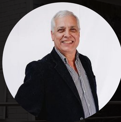
VEREADOR AMARO AZEVEDO (PDT)