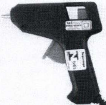
Pistola de cola quente pequena potencia 10W com dois refis