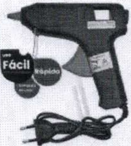
Pistola De Cola Quente Bivolt 10w E 40w Tool Flex